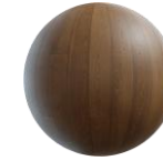
Piso SPC en recámaras