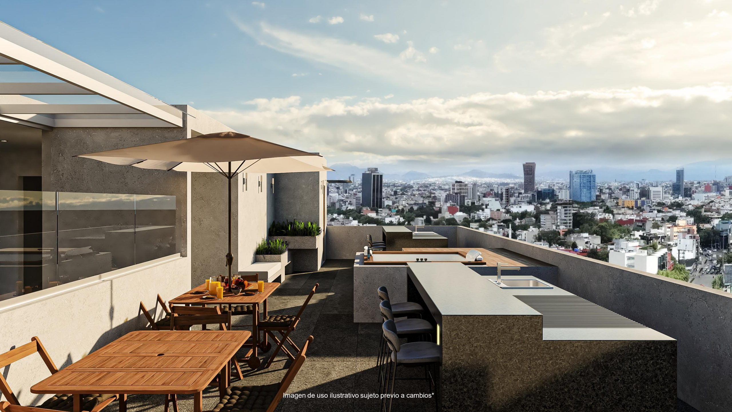
Imagen de uso ilustrativo sujeto previo a cambios*