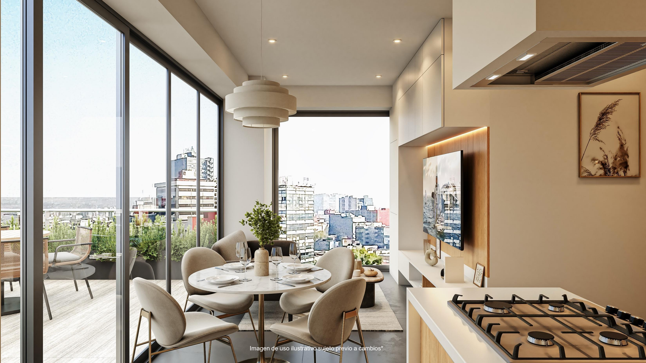
Imagen de uso ilustrativo sujeto previo a cambios*