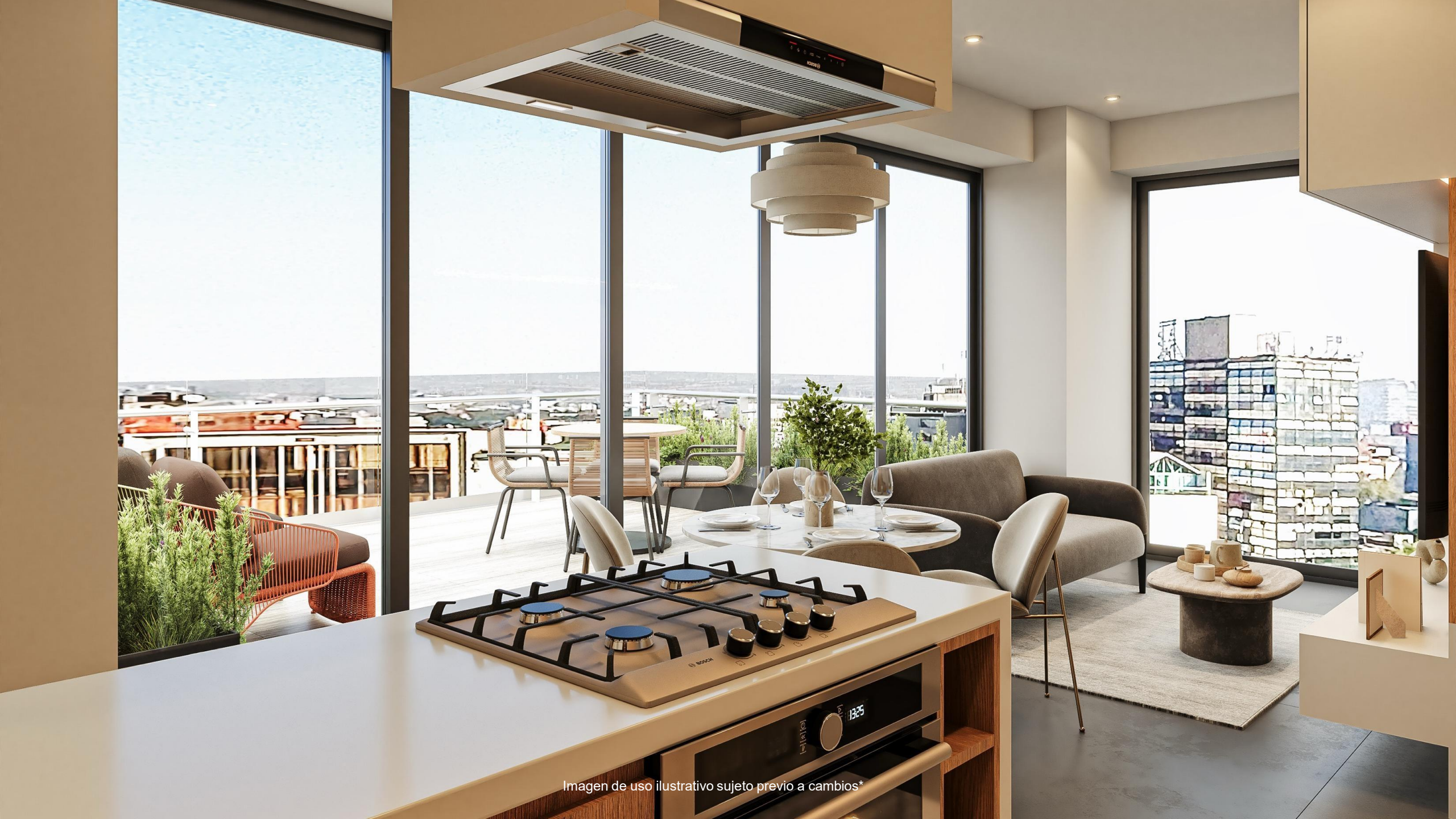
Imagen de uso ilustrativo sujeto previo a cambios*