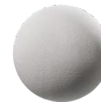
Aplanado de yeso