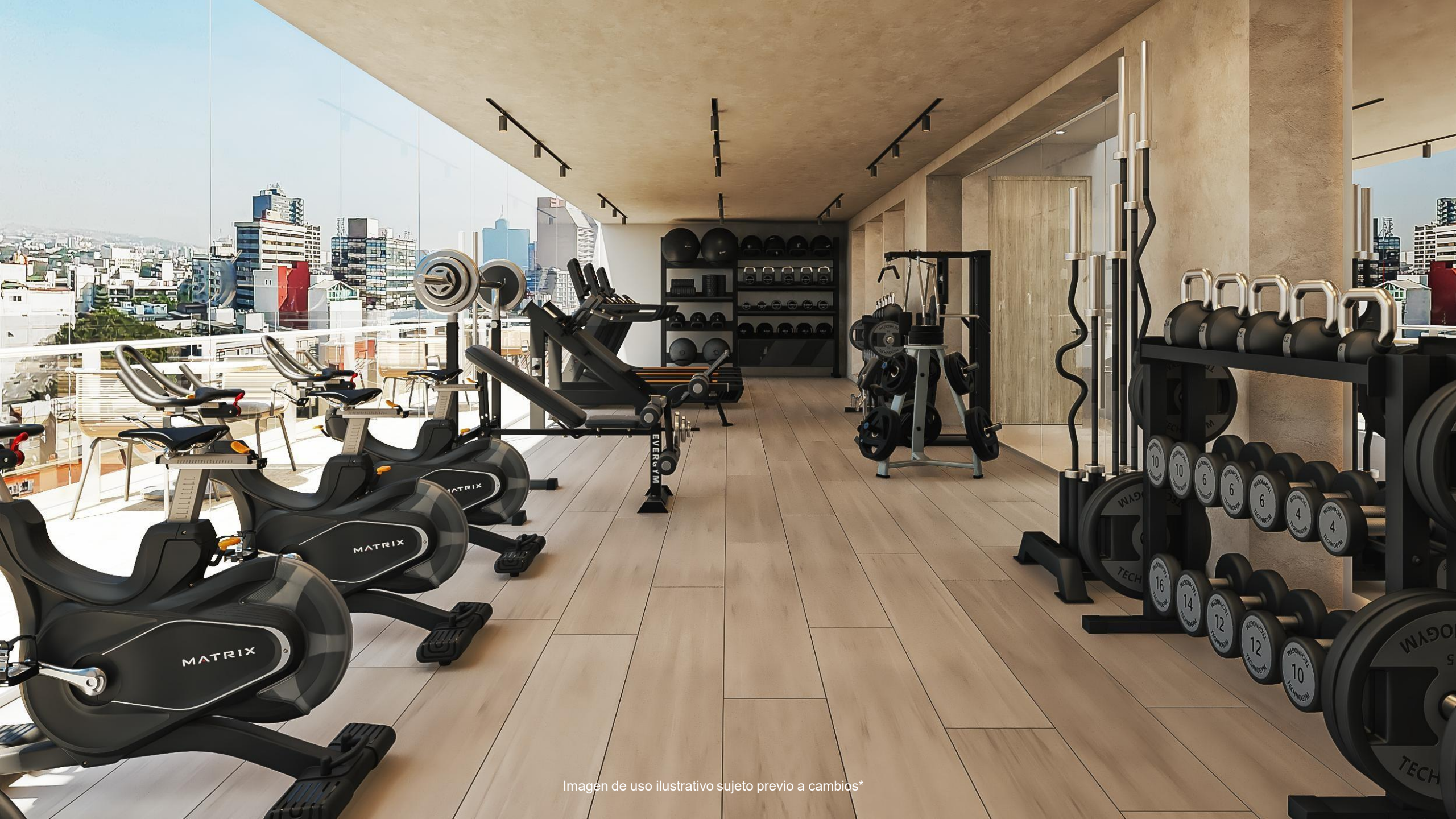
Imagen de uso ilustrativo sujeto previo a cambios*