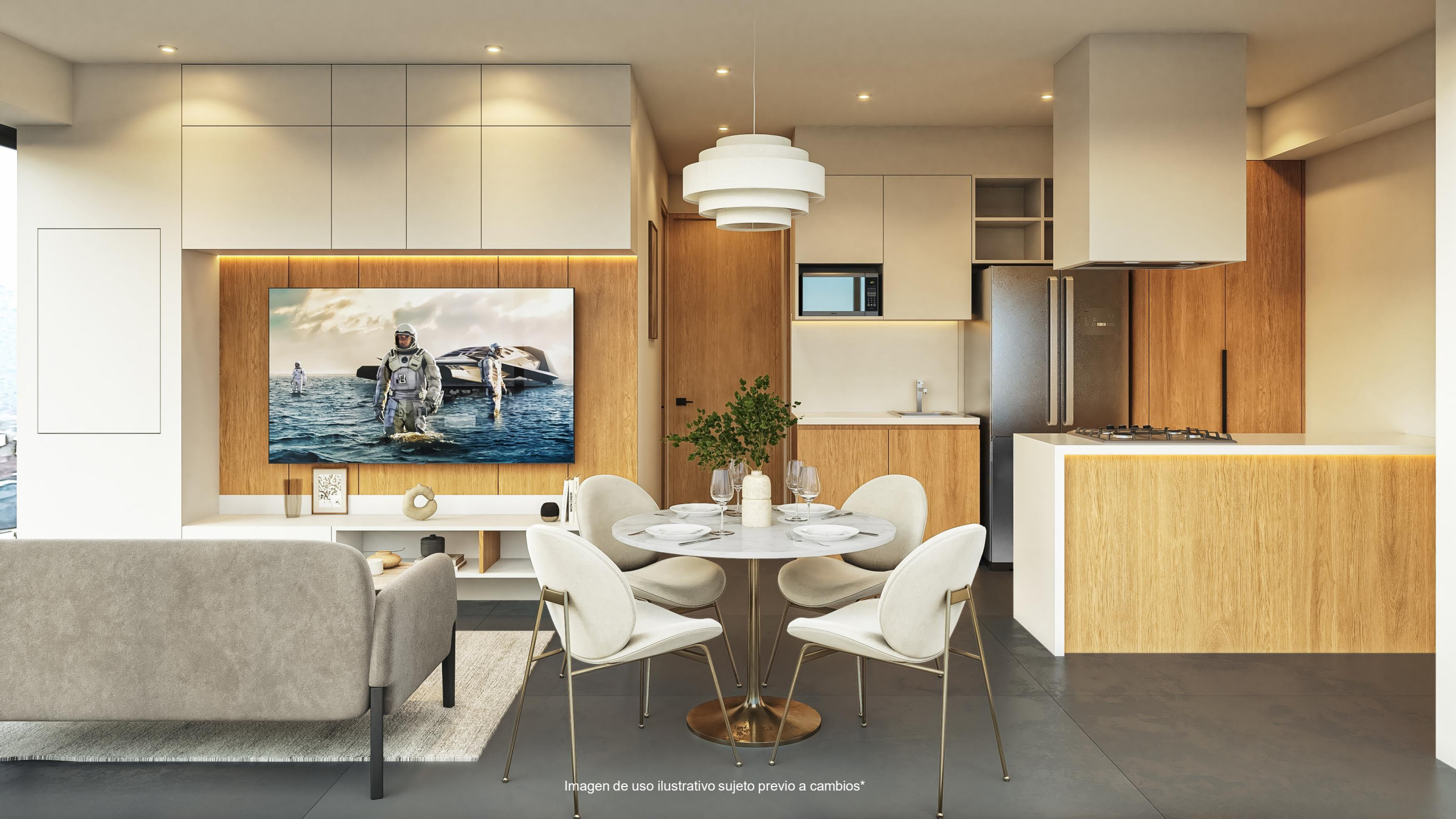
Imagen de uso ilustrativo sujeto previo a cambios*