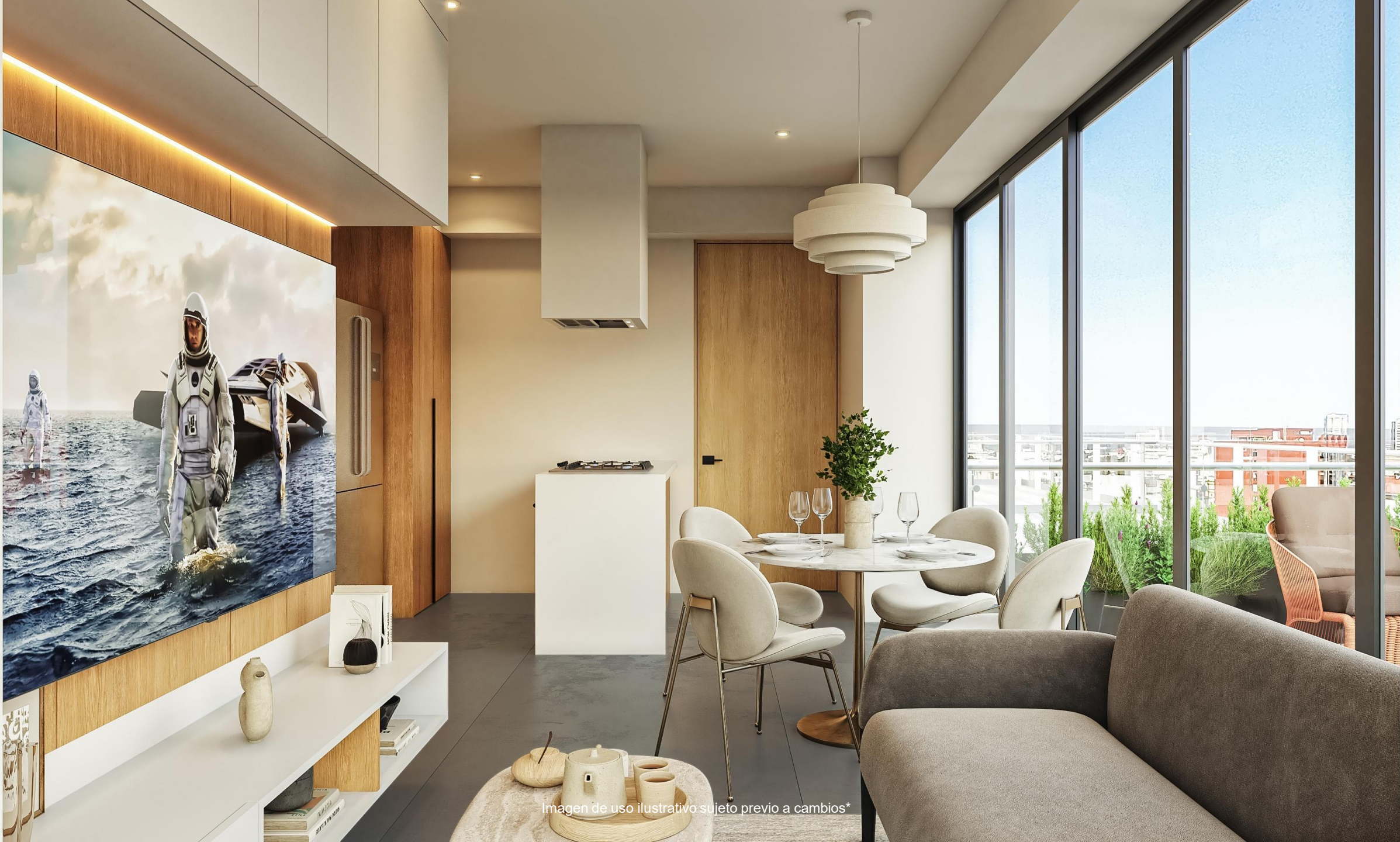
Imagen de uso ilustrativo sujeto previo a cambios*