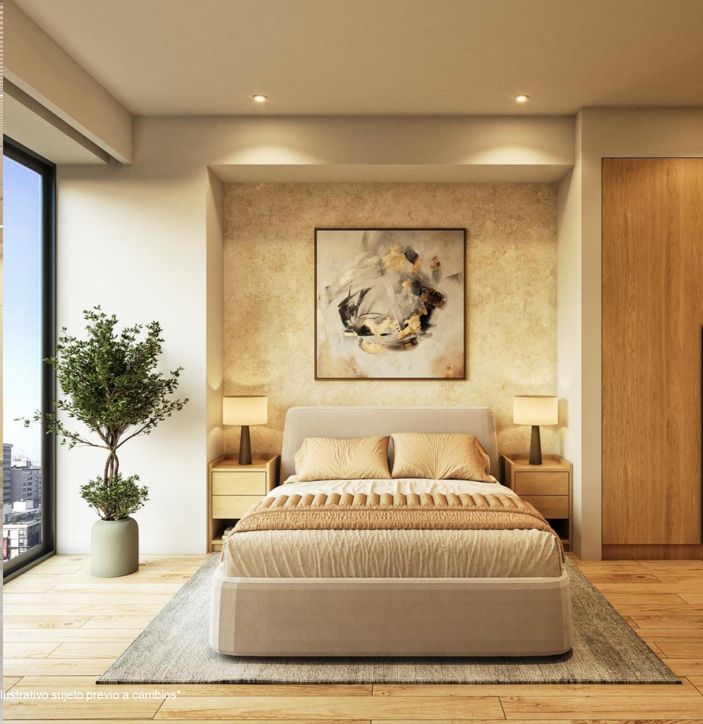
Imagen de uso ilustrativo sujeto previo a cambios*