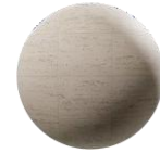
Mármol en Cocinas y Baños