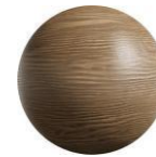
Melamina Mod "Copal"